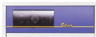
Панель управления CTC Silver BL/Silver